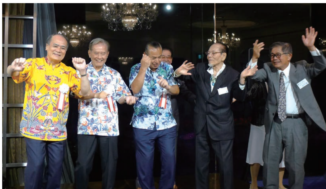
2018年6月15日第52回関東沖縄経営者協会定時総会・懇親会の舞台にて