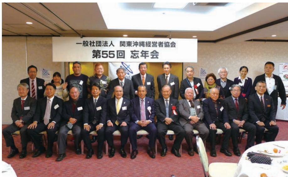
一般社団法人 関東沖縄経営者協会 第55回 忘年会