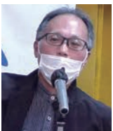
喜屋武靖映画監督