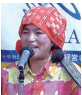
宮川たま子さんの お笑いライブ