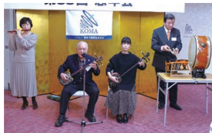
沖縄音楽三線教室による三線演奏