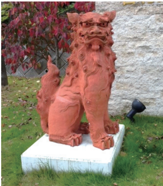
施設内のシーサー