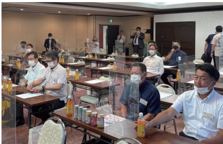
お土産にオリオンビール新商品詰合わせセットをいただきました。