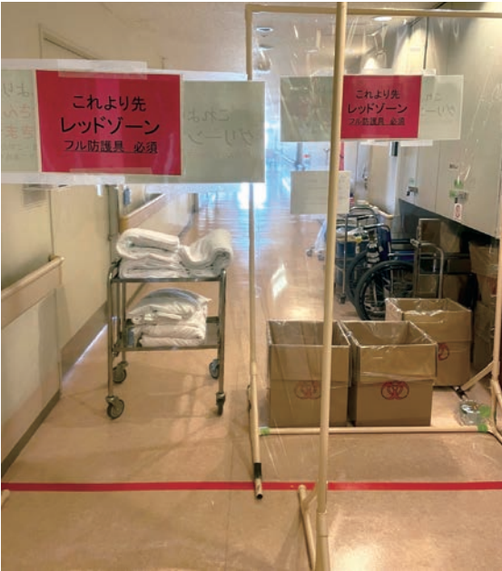
隔離されたベッド