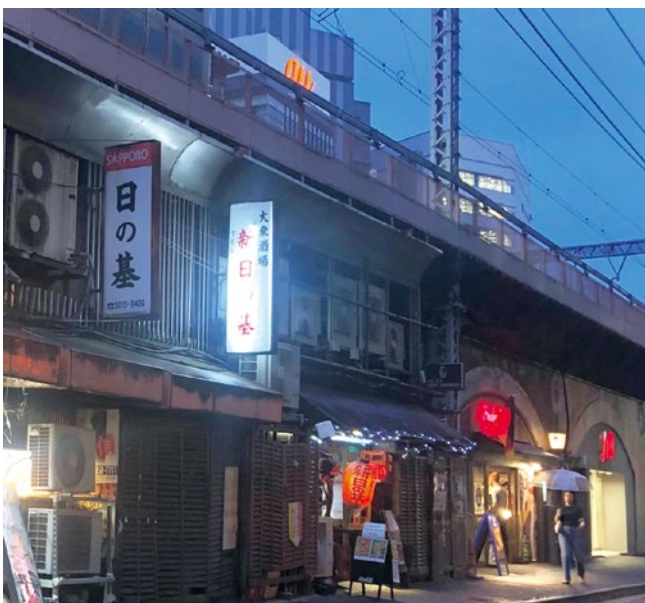
「日の基引揚者一泊寮」があった場所

がまだ環状線になる前の1910年に開業しています。駅舎はレンガ造りのアーチ橋が特徴で、現在は耐震工事の終わった箇所もあり、ずいぶん綺麗になっています。戦後、日本各地に闇市が出現するのですが、有楽町界隈には、今の京浜東北線の高架下に「日の基引揚者一泊寮」という引揚者が寝泊まりする宿泊施設がありました。一度に120人ほどが収容でき、主に東北地方に引き上げる人の利用が多かったようです。現在もその名残のある古い飲食店が残っていますが、工事が始まればそういう場所も消えていくと思います。その前にぜひ足を運んでみてはいかがでしょうか？ (次号PART2へつづく)