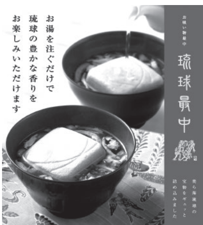
お湯を注ぐだけで琉球の豊かな香りを、お楽しみいただけます