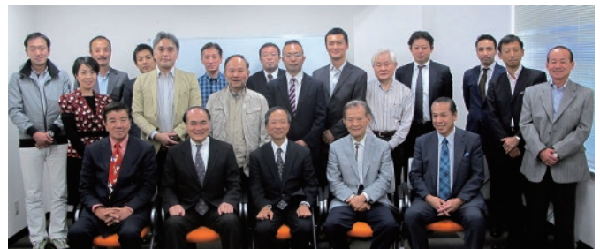
中野会長を囲んで