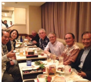
東京進出おまちしています！

11月7日、那覇市のライプハウスのGALAで沖繩賛助会員懇親会が開催されました。東京から19名沖繩から26名の総数45名で会場は一杯、地元にも多くの人脈