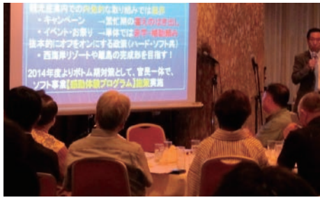
入域観光客総数1,000万人を目指す

2015・6・26 講演会 「サービズ産業経営と 沖繩観光の展望」 定時総会特別講演